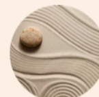
"Clé en Main Expert"